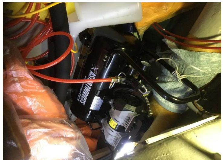
↑市販のポンプを「海水こし器」につなぐ